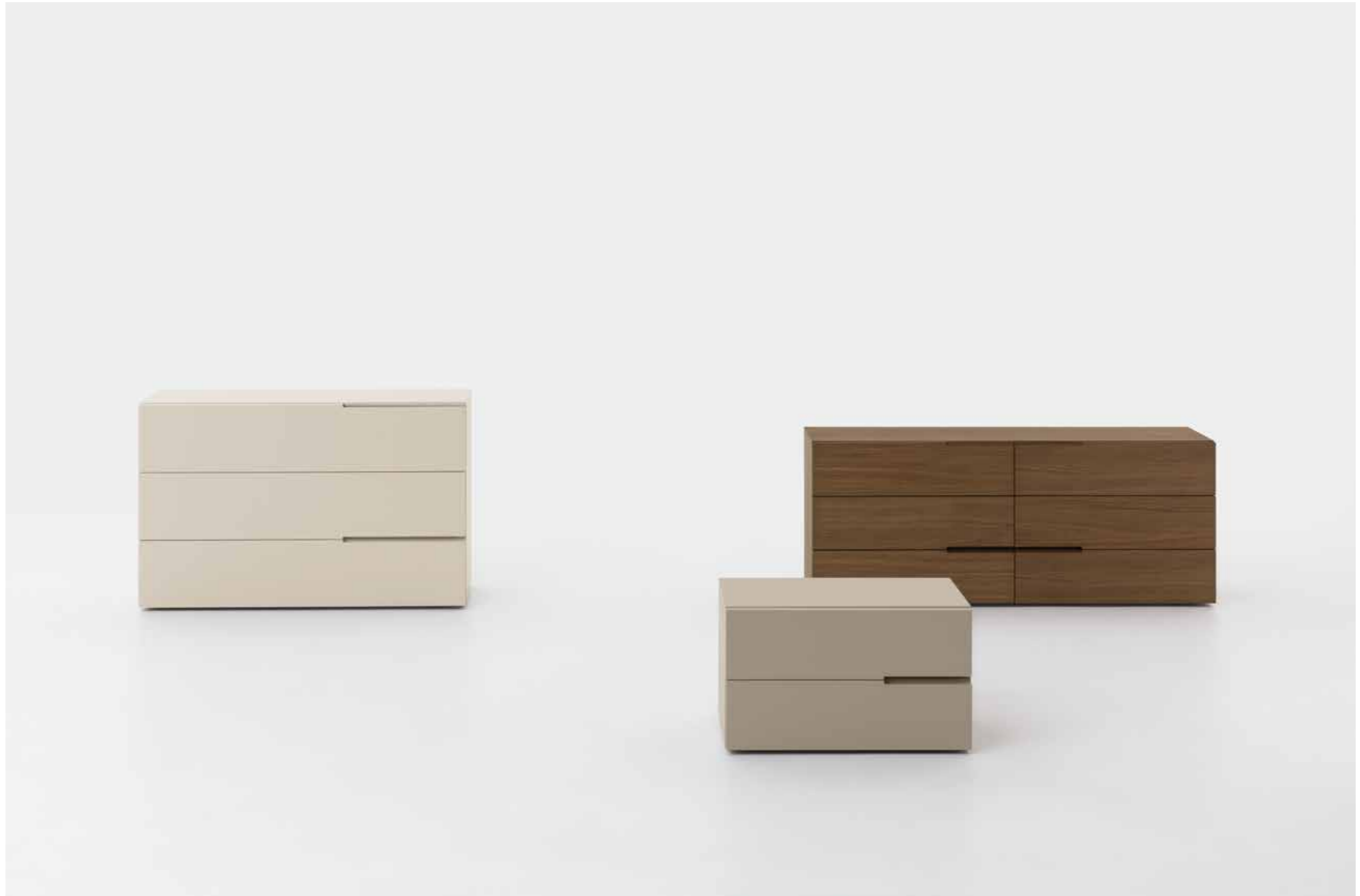
Segno comò laccato opaco Seta. Comodino laccato opaco Ecrù. Comò Canaletto. / Segno Seta matt lacquered dresser. Ecrù matt lacquered night table. Canaletto dresser.