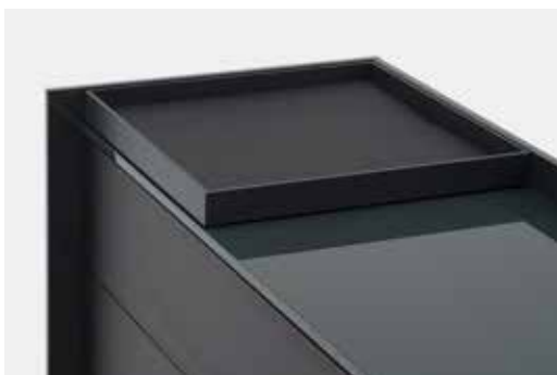
Dettaglio vassoio EN Tray detail

W 11.81" H 1.97" D 17.72" W 17.72" H 1.97" D 17.72" W 23.62" H 1.97" D 17.72"